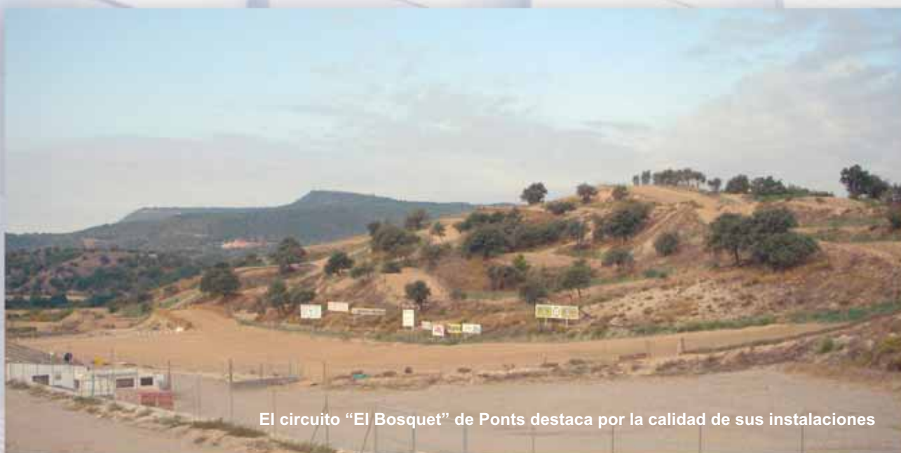
El circuito "El Bosquet" de Ponts destaca por la calidad de sus instalaciones

http://maps.google.es/maps/ms?t=h&hl=es&ie=UTF8&msa=0&ll=41.903619,1.193261&spn=0.020634,0.045447&z=15&msid=114489237898930875405.000472faddc4e8ec2877b