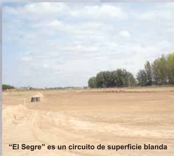
“El Segre” es un circuito de superficie blanda