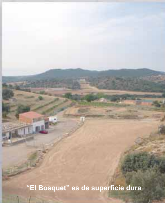
“El Bosquet” es de superficie dura