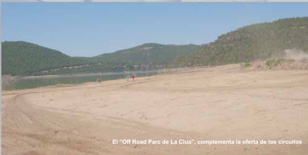
El "Off Road Parc de La Clua", complementa la oferta de los circuitos

http://maps.google.es/maps/ms?ie=UTF8&hl=es&mmsa=0&msid=114489237898930875405.000472fde30b607c11846&ll=41.991012,1.282997&spn=0.020605,0.045447&t=h&z=15