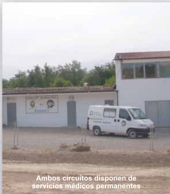
Ambos circuitos disponen de servicios médicos permanentes