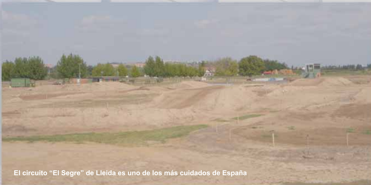
El circuito "El Segre" de Lleida es uno de los más cuidados de España

http://maps.google.es/maps/ms?t=h&hl=es&ie=UTF8&msa=0&msid=114489237898930875405.000472f97ff036888c912&ll=41.580268,0.595236&spn=0.041476,0.090895&z=14