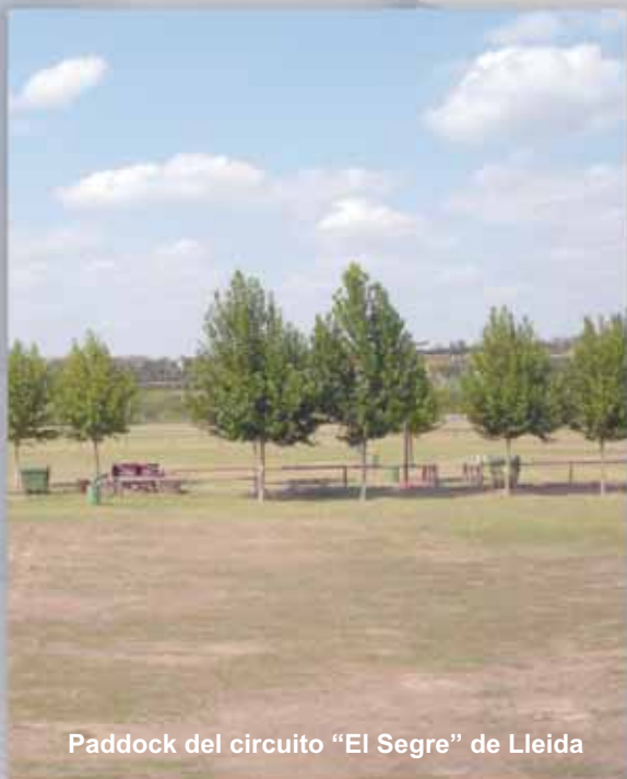
Paddock del circuito "El Segre" de Lleida